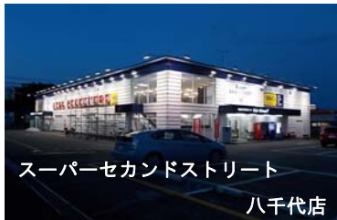
スーパーセカンドストリート 八千代店