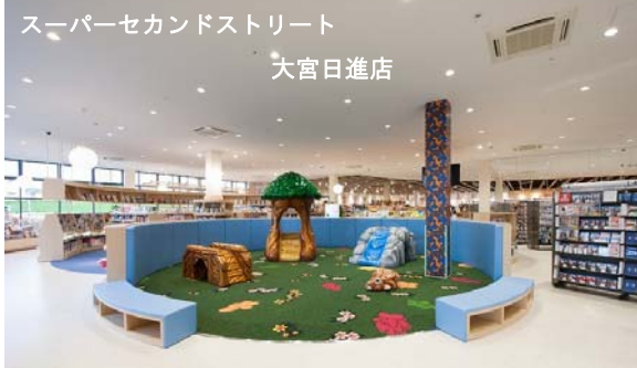
スーパーセカンドストリート 大宮日進店

女性・ファミリーをターゲットとした融合店（5月） キッズスペース・体験型イベント・スタイル提案を重視