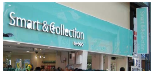
Smart & Collection 名古屋大須店出店（4月）