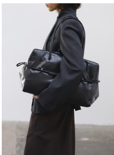
BELT BAG / BLACK 30,800 円 (税込)