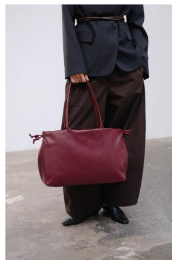
MILOS BAG / CHERRY RED 28,600 円 (税込)

特設ページ： https://olend.jp/shibuyaparco2026/