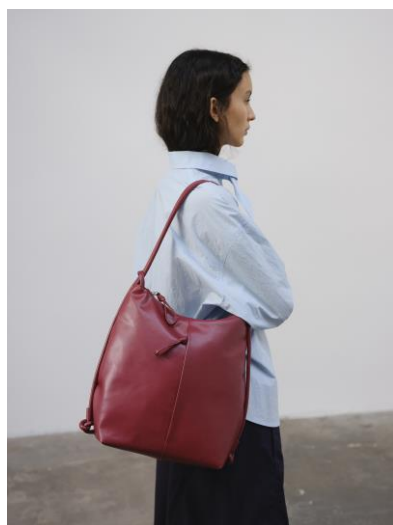
ELIO / CHERRY RED 25,300 円 (税込)

CHARM (TOMATO / PEANUT)、販売価格 7,700 円 (税込)