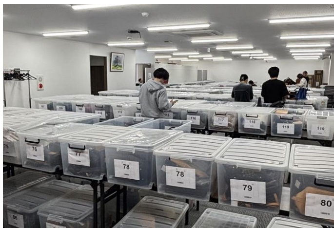
<「おお蔵市場」オークション会場>

近年、高級時計ブランドおよびラグジュアリーブランドの価格高騰、品薄を受け、高級時計や一部ブランドのアイコンバッグ、貴金属などは「投資・資産」を目的として取引されるケースが増えています。このような状況下では、それらの二次流通市場が、今後より一層活性化すると予測されます。一方で、それらの商品は取引額が高額、かつ偽造品の流通も多いことから、プロによる公正な評価で取引の安全性が保証される B to B オークションの重要性が増しています。