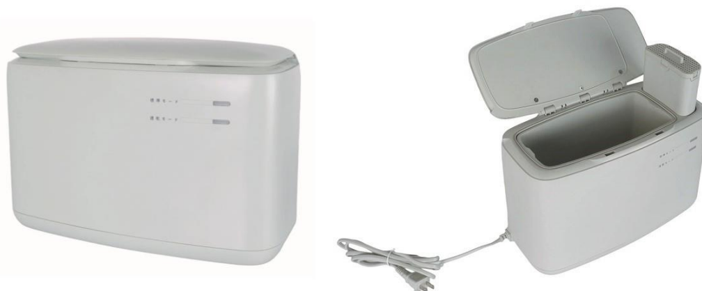
<『生ごみ乾燥機 G (GO-NM01LG)』製品画像>