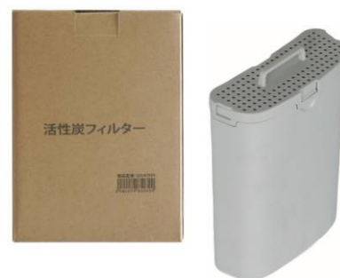
<パッケージ・製品画像>