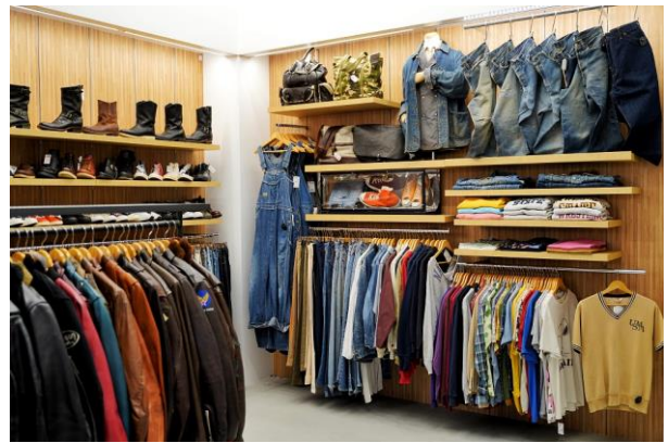
<セカンドストリートアメリカ村店 店内イメージ画像>