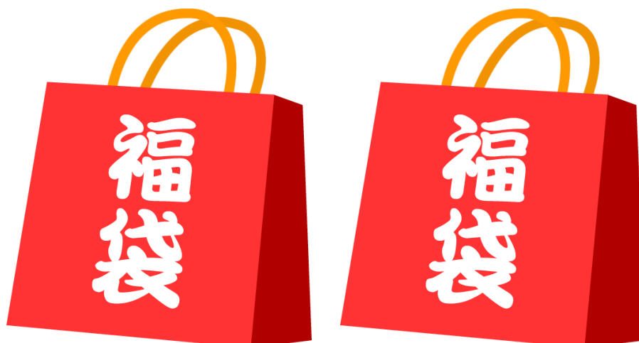
<福袋イメージ画像>

本件に関するお問い合わせは下記までお願いします 株式会社ゲオホールディングス 広報部 広報課 担当：大滝 TEL：03-5911-5784 E-mail：geo-pr@geonet.co.jp