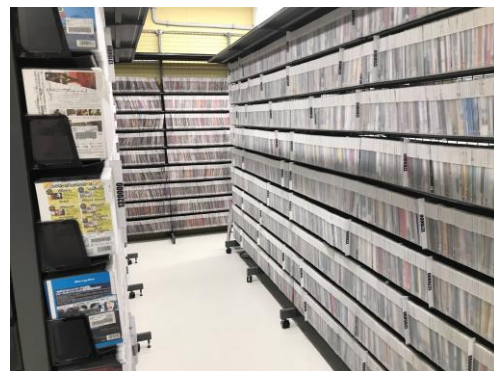
<バックヤード イメージ>

11月27日（水）にゲオスピードの2号店としてオープンする「ゲオスピード祖師ヶ谷大蔵店」の売り場面積は7坪で、在庫数は通常のゲオショップの約1.5倍の10万本です。この狭小店での大量在庫は、店内にDVDなどのパッケージを陳列せず、バックヤードに薄いケースで保管するという形式で実現しました。料金はDVD・ブルーレイ旧作の基本料金が1枚50円からで、利用日翌日の13時以降からは、レンタル日数に応じて追加料金が加算される従量課金制となります。なお、DVD・CDのレンタルに加え、新品・中古ゲームソフトおよびゲーム機器の販売も行います。