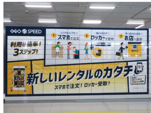
<ロッカー イメージ>

ゲオは、現代の多様化する生活スタイルから生まれるニーズに応えるべく、DVD・CDのレンタルの新業態としてスマートフォン上で「かんたんに注文・決済」ができ、「通勤や買い物の途中」などで、「誰にも会わずに受け取る」ことができる、24時間営業の“非対面式ロッカー型レンタルショップ”「ゲオスピード」を開始し、2019年10月24日に1号店となる「ゲオスピード仙川店」をオープンしました。