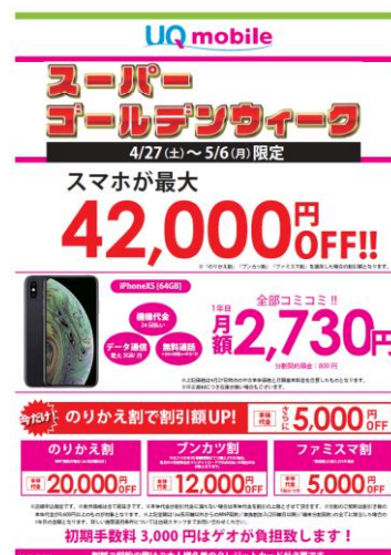
<UQ mobile スーパーゴールデンウィーク POPイメージ>

契約者または利用者が5～18歳（※3）で音声通話対応 SIM の契約時に「学生割」に加入すると端末の価格が5,000円オフとなります。