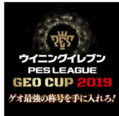
<ウイニングイレブン GEO CUP 2019 ロゴイメージ>