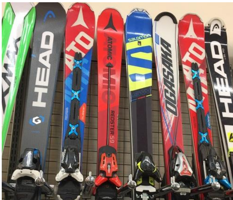
<セカンドストリート売場イメージ画像>

本件に関するお問い合わせは下記までお願いします 株式会社ゲオホールディングス 広報部 広報課 担当：大滝 TEL：03-5911-5784 E-mail：geo-pr@geonet.co.jp