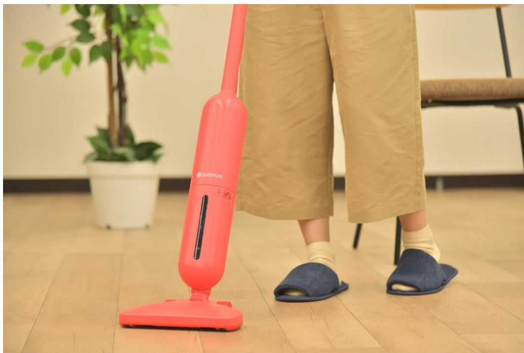
<大掃除イメージ画像>

本件に関するお問い合わせは下記までお願いします 株式会社ゲオホールディングス 広報部 広報課 担当：大滝 TEL：03-5911-5784 E-mail：geo-pr@geonet.co.jp