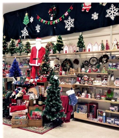
<セカンドストリート売場イメージ>

本件に関するお問い合わせは下記までお願いします 株式会社ゲオホールディングス 広報部 広報課 担当：大滝 TEL：03-5911-5784 E-mail：geo-pr@geonet.co.jp