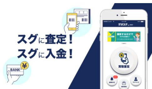
<「ゲオスグ」App Store サムネイル画像>

「ゲオスグ」がサービスを開始した2018年8月27日から9月末日までの約1か月間の累計で、取引が成立したゲームソフトおよびゲーム機本体の買取数量の割合を機種ごとに比較したところ、1位が「PlayStation®4」(23.59%)、2位が「Nintendo Switch™」(14.08%)、3位が「ニンテンドー3DS™」(13.82%)で、これら3機種で過半数を占める結果となりました。