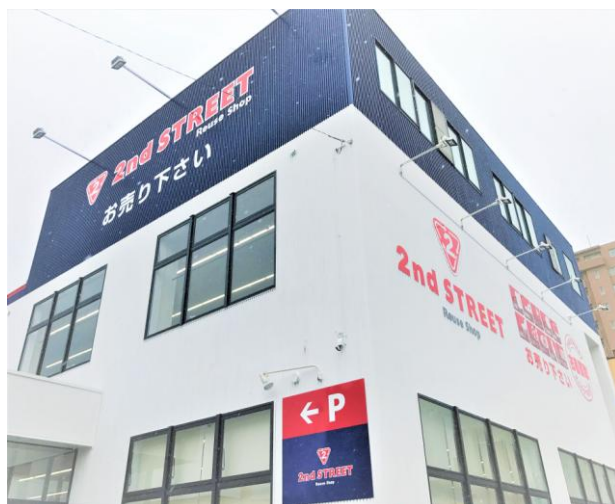
<セカンドストリート豊平36号店 外観写真>