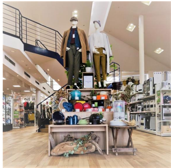
<セカンドストリート可児店 内観写真>