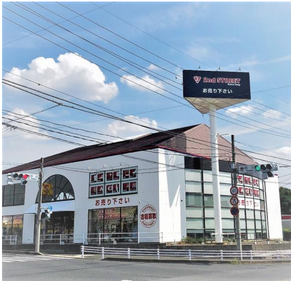
<セカンドストリート可児店 外観写真>