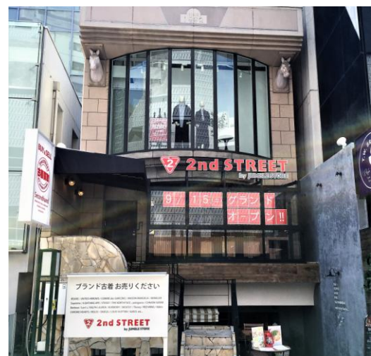
<セカンドストリート静岡伝馬町店 外観写真>