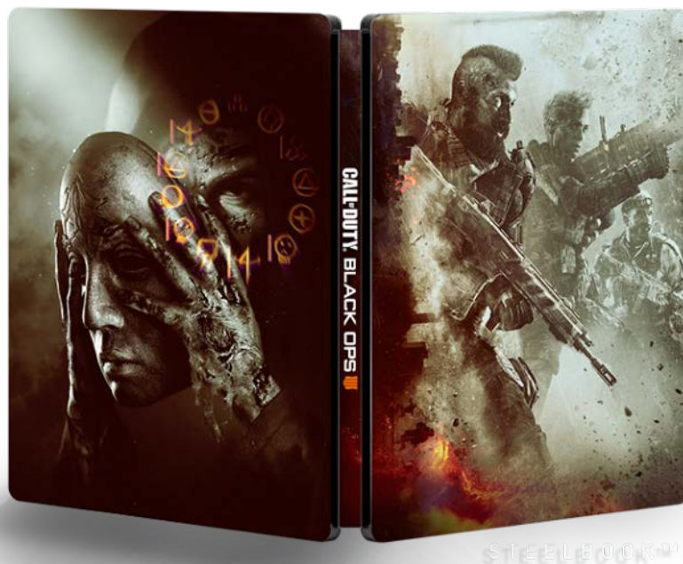
<ゲオ限定特典「スチールブック」外観イメージ>

【コール オブ デューティ ブラックオプス 4 公式サイト】 https://www.callofduty.com/ja/blackops4