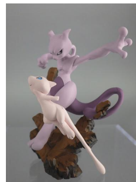
「ミュウ&ミュウツー フィギュア」 イメージ画像 造形企画制作：株式会社海洋堂 原型制作：香川雅彦

ゲオでは、2018年11月16日(金)に発売する、「ポケットモンスター Let's Go! ピカチュウ モンスターボール Plus セット」と、「ポケットモンスター Let's Go! イーブイ モンスターボール Plus セット」(価格：9,980円、発売元：株式会社ポケモン)の予約受付を数量限定で、2018年7月13日(金)より、全国のゲオショップ約1,200店舗にて実施しています。両商品とも、「ミュウ&ミュウツー」のゲオ限定特典フィギュアが付きます。