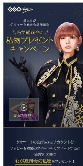
<ツイッターキャンペーンページイメージ>