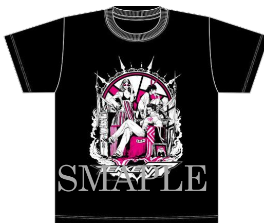
<鉄拳7オリジナルTシャツイメージ>