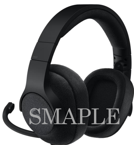
<G433 7.1有線サラウンドゲーミングヘッドセット>