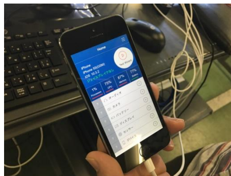
データ消去・動作チェック作業