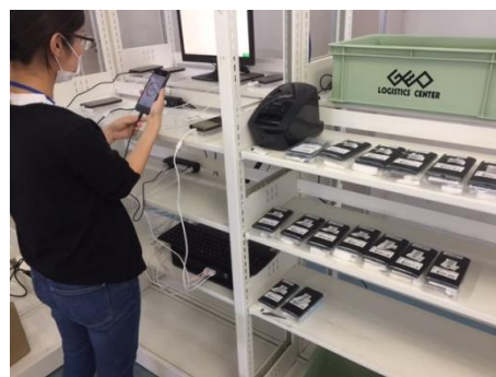
個人情報消去作業

1億円を投資して2017年4月に開設した延べ床面積 4,560㎡（1,379坪）の「プロセスセンター」は、店舗を介さない法人からのスマートフォン大量仕入れ商品と、店舗などで買い取った商品を再生（※1）し、Eコマースへのスピーディーな出品を実現しています。8月からはEC専門組織が常駐し、センターからダイレクトにインターネットで販売することが可能となりました。買取・商品の再生・EC機能を集約・一元化したゲオモバイル事業の中核施設として、2018年度には、EC化率は20%（※2）を目指しています。