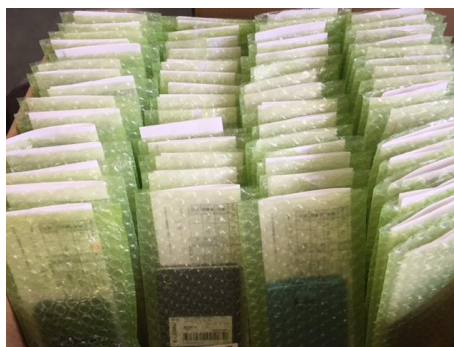
大量仕入れされたスマートフォン ・携帯端末