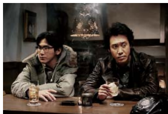
「探偵はBARにいる3」 ©2017「探偵はBARにいる3」製作委員会

＜調査概要＞ 調査対象 「ゲオアプリ」会員 集計期間 2018年2月1日 ～2月4日 回答者数 9,879人