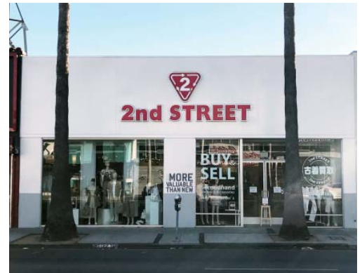
セカンドストリートメルローズ店 外観

現地の音楽関係者やスタイリスト、俳優など著名人をはじめ多くの方々にご来店いただきました。男性、女性の比率はほぼ半々で、年齢層としては20代から30代前半がメインです。日本国内に比べ、10代が多く、色味や柄などデザイン性の強い商品が好まれるのが印象的です。