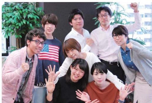
ダイバーシティ推進プロジェクトのメンバー