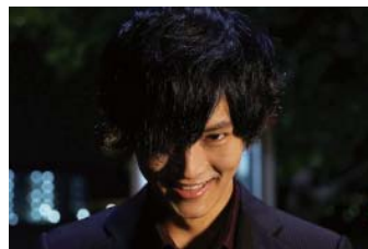
「不能犯」 ©宮月新・神崎裕也/集英社2018「不能犯」製作委員会