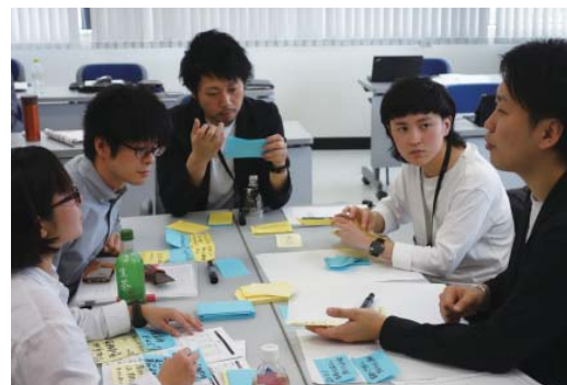
プロジェクトでは活発な意見交換が行われる