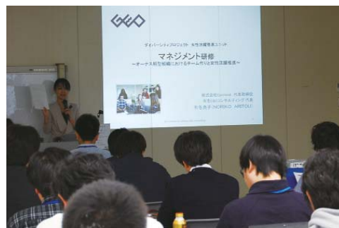
ゼネラルマネージャー・マネージャー向けマネジメント研修

「人が環境をつくり、環境が人をつくる」という言葉がありますが、私たち自らが情報を発信しながら、女性の望むスタイルで働ける環境をつくっていくことが大事です。組織において多数派と少数派は必ず生まれますが、多数派と少数派が同化せず、分離せず、いかにお互いの違いを生かしていくかが大事であって、そのような社風を築き上げた企業がこれから競争優位性を勝ち取っていくのだと思います。