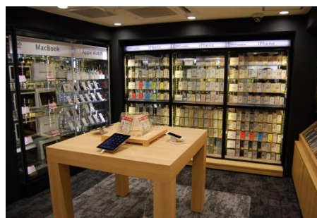
ゲオモバイル アキバ店 iPhone フロア

※2：MMD研究所（MMDLabo 株式会社）「2016年3月格安 SIM サービスの利用動向調査」