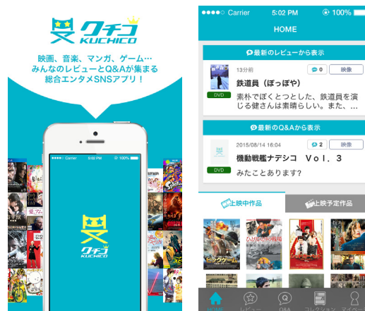
「クチコ」イメージ画像

この度、ゲオが提供するレビューSNS アプリ「クチコ」は、商品レビューを通してユーザー同士が繋がることができる SNS 型のレビューアプリです。映画だけではなく、音楽、マンガ、ゲーム、CD などの幅広いエンタメ作品において、ユーザー同士で作品の評価やレビューコメントなどの情報交換ができます。自分の好きな作品を集めたコレクションボードを公開することもでき、ユーザー同士のコミュニケーションがより活発化されます。ゲオ会員であれば、レンタル履歴も表示・閲覧が可能となり、また、作品への Q&A 機能の充実や店頭在庫とも連動しているため、会員証機能アプリ「ゲオ公式アプリ」との連携の強化、さらに、オムニチャンネルリテリングの強化に繋がると見込んでおります。