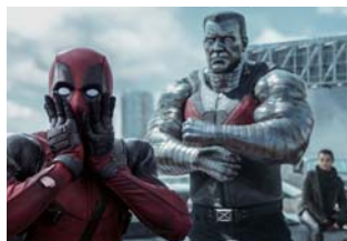
「デッドプール」公開中

調査対象 「ゲオアプリ」の会員 集計期間 2016年7月4日～11日 回答者数 4万8,609名 (男性 2万4,090人 女性 2万4,519人)