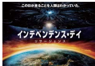
「インデペンデンス・デイ：リサージェンス」公開中 ©2016 Twentieth Century Fox Film Corporation. All Rights Reserved.