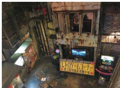
香港・九龍城をモデルにしたアミューズフロア