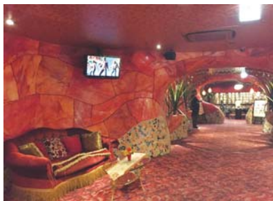
5階のインターネットカフェはスペインの洞窟風