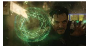
「ドクター・ストレンジ」公開中