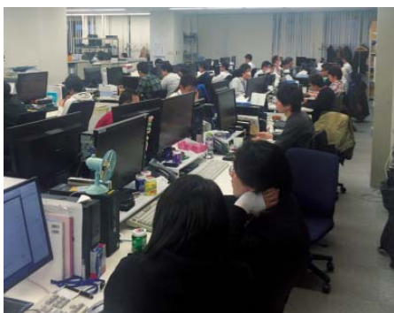
業務システム部には50人以上のスタッフがおり、グループのシステム管理やシステム開発を一手に担っている

加えて、多数のお客さまの個人情報扱うゲオグループでは、セキュリティ面での対策も重要です。昨年度にはIPS・IDS（不正侵入検知・防御システム）を導入しましたが、標的型サイバー攻撃への対策として注目されているEDR（Endpoint Detection and Response）や、次世代アンチウィルスソフトの導入も検討しています。