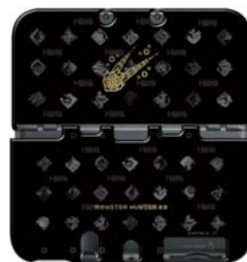
← オリジナルカバー