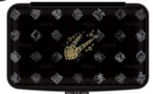
オリジナルポーチ